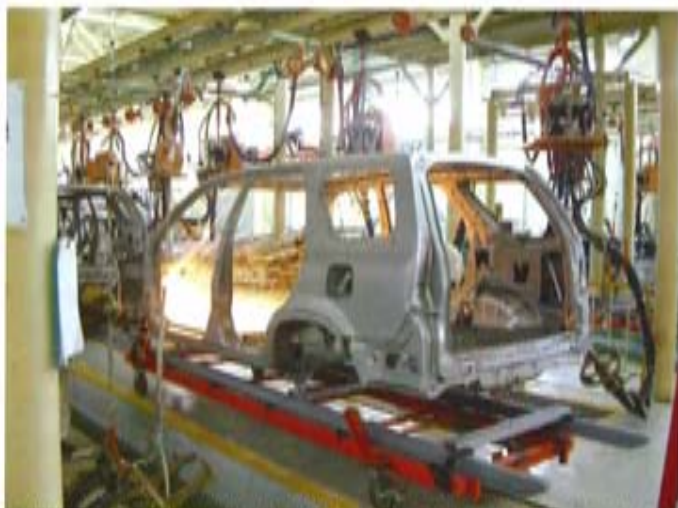
民营企业与国有企业的联合，国有企业对民营企业进行收购与兼并的新模式，使原来的民营企业在保持自身优势的同时提高了道德的约束，也使国有企业则弥补了运行机制上的缺陷。

时，一般都不会出现人浮于事的局面，但民营企业在其快速的发展过程中，在其需要一次次上台阶、上规模，实现更高数量级的飞跃时，就出现了人力资源短缺的现象。由于大多数民营企业科研技术人才缺乏，自己没有研发力量。另外有的中小型民营企业没有自己的核心技术，现有技术落后，企业缺乏发展后劲和核心竞争力。由于管理、体制等原因，这些中小型民营企业又往往难以吸引和留住人才。