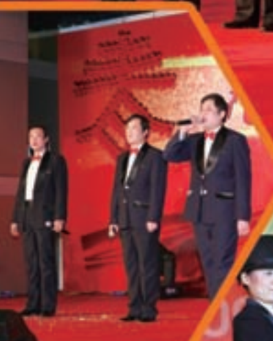
中国建材集团领导 向来宾及全体员工拜年