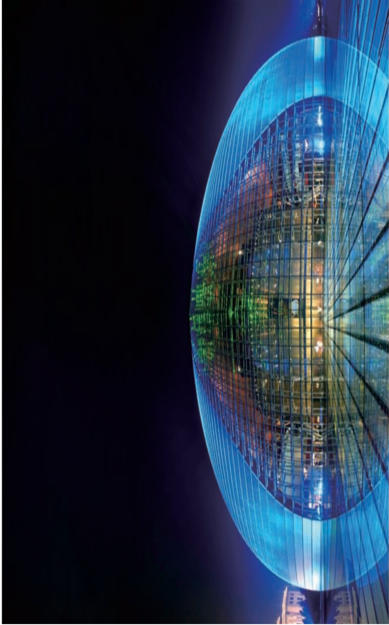
中国大剧院